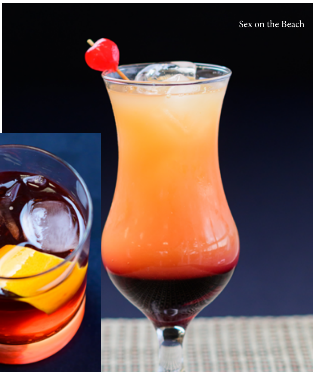
Sex on the Beach